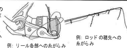
例：リール各部への糸がらみ

ツイストバスターは、糸巻き取り時のヨレ※1を大中に解消しました。ご使用方法はカンタン。基本的には、これまでのスピニングリールと同じです。ただし、お客様が糸を巻かれるときには、最初からツイストバスターの性能を十分に発揮させるため、以下の方法をおすすめします。